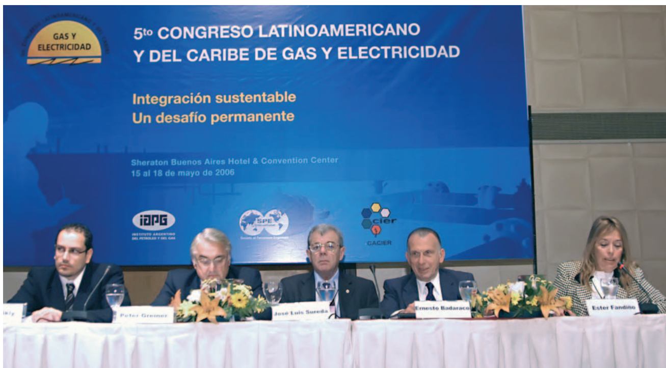
La integración energética regional parece ser la mejor opción para el comercio internacional.