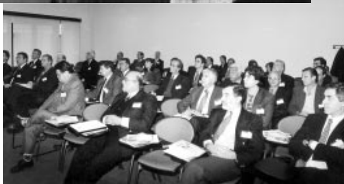
Parte de los asistentes sigue atentamente las exposiciones.